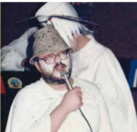
Ball 1997 - Alpenyeti