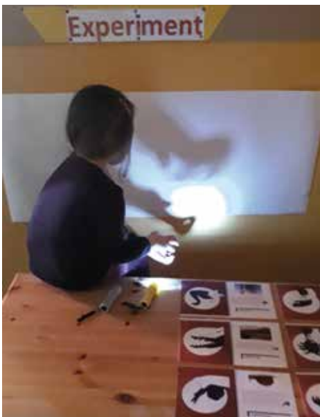
Welches Tier ist das?