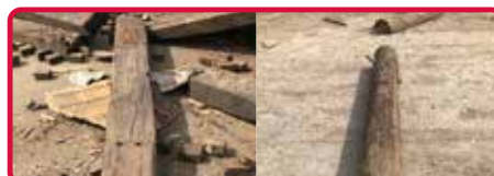
Bahnschwellen, Pfähle, Masten