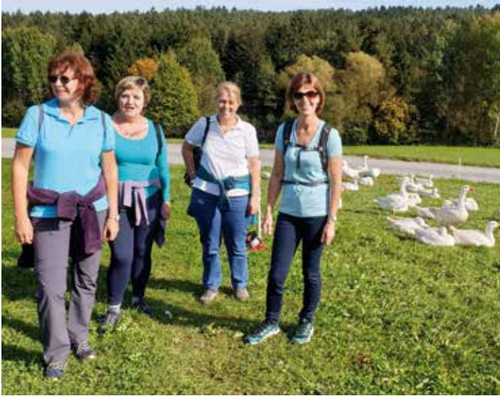
Auf der Route begegneten den Frauen Gänse und Enten.