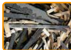
Altholz mit Bitumen- anstrich, Dachpappe