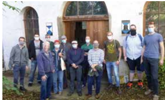
Firmenausflug - Besichtigung mit Maske

Nun möchten wir noch unseren Mitgliedern, Freunden und Sponsoren unseren herzlichen Dank aussprechen für ihre Wertschätzung dieses einzigartigen Kulturgutes!