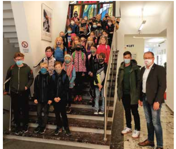
LehrerInnenteam der VS Ligist

Die Kinder der beiden 4. Klassen besuchten am 9. Oktober bekannte Sehenswürdigkeiten in unserem Bezirk. Im Rathaus Voitsberg wurden sie von BM Osprian herzlich begrüßt, dann ging es zur Burgruine, nach Piber und Bärnbach.