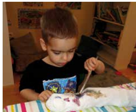
Socken bemalen im Kindergarten

In den Kindergärten wurden von den Kindern Socken gebastelt, welche vom Nikolaus mit Nascherein aufgefüllt wurden. In der Volksschule gab der Nikolaus für jedes Kind ein Geschenksackerl ab. Diese Sackerl wurden vom Lehrpersonal am ersten Schultag nach dem Lockdown an die Kinder verteilt.