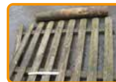
Imprägnierte und behandelte Holzabfälle aus dem Außenbereich