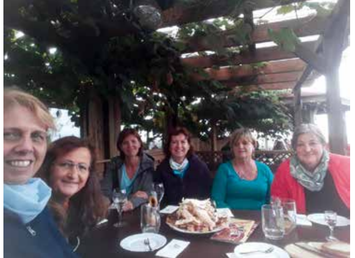
Nach der Wanderung stärkten sich die Frauen bei selbstgemachten Schmankerln.