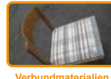
Verbundmaterialien mit hohem Holzanteil