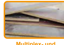
Multiplex- und Siebdruckplatten