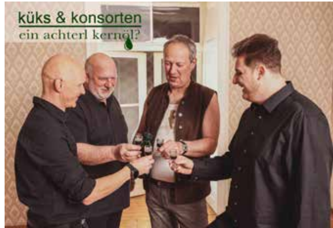
Der Eintritt ist eine freiwillige Musikspende!