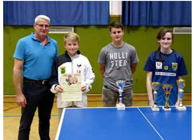
Der UTTTC Ligist gratuliert zu den Erfolgen und freut sich auf das Tischtennis-Ferien-Camp vom 23. bis 25. August!

In den Bewerb U15 nahmen 52 Kinder teil, und im Bewerb U13 gab es 42 Teilnehmer aus der ganzen Steiermark.